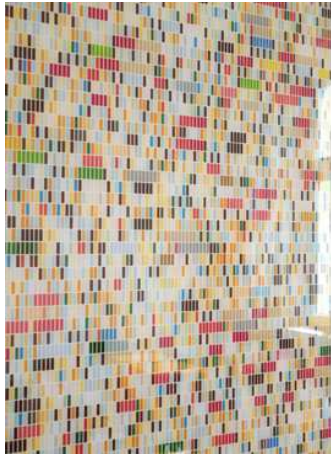
Eva-Maria Bolz, Der Innere Monitor , 2013, Detail

Texte in Form großer Farbtafeln präsentieren. Zusätzlich zu den Farbtafeln wird eine Dokumentation in Form eines Künstlerbuchs angelegt.